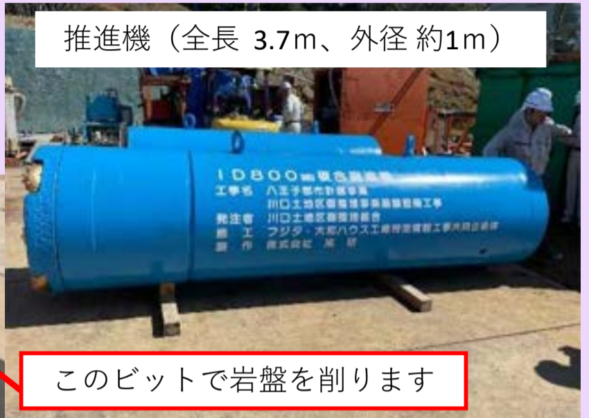
推進機（全長 3.7m、外径 約1m）