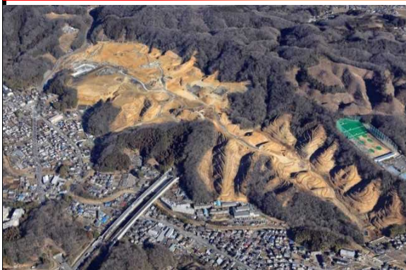
航空写真全景 2/20撮影