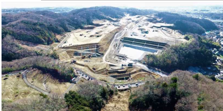
都道（美山通り）より全景 3/20撮影