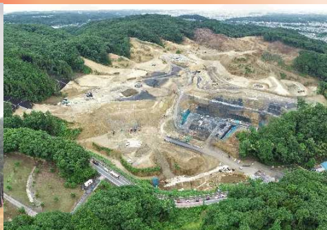
現場全体写真6/16撮影