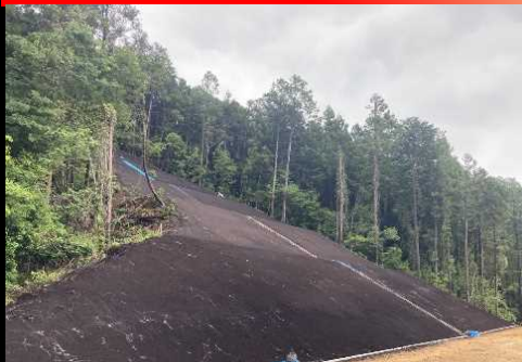
法面工事写真 6/9撮影