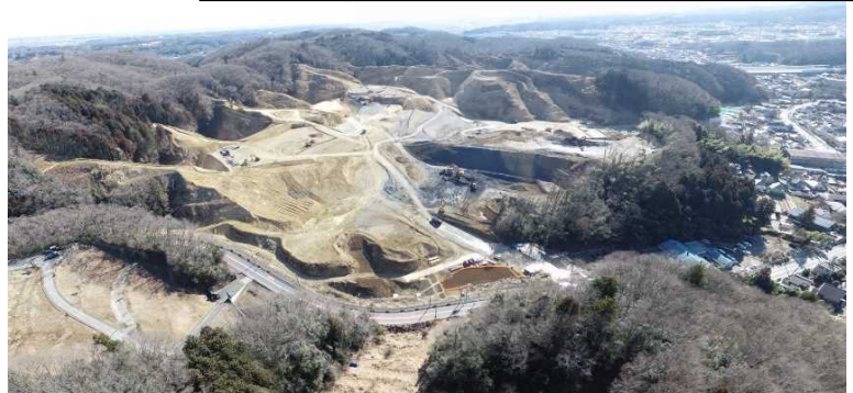
都道(美山街道)より全景