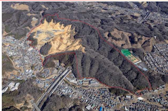
航空写真全景 2/28撮影